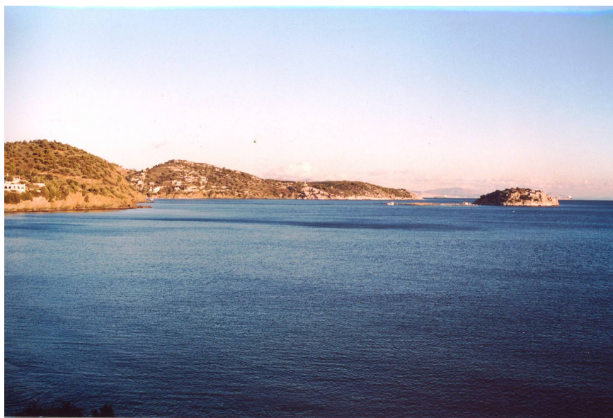
Άποψη του Κόλπου και της νησίδας του Πέρανι, από τα δυτικά/βορειοδυτικά.

Στην βραχονησίδα Περανήσι, νησιωτικό οχυρωμένο καταφύγιο, όπως η Ψυττάλεια και η Αταλάντη, των Πρωτοβυζαντινών χρόνων (6ου-7ου αι. μ.Χ.) στον κόλπο του Πέρανι, ιδιαιτέρως σημαντικό στο πλαίσιο της Αρχαιολογίας των ξενικών επιδρομών στην Ελλάδα, η επιφανειακή έρευνα έχει εισφέρει αξιοσημείωτα στοιχεία. Το σημαντικότερο αποτέλεσμα των ερευνητικών εργασιών υπήρξε η εκπόνηση του πρώτου αρχαιολογικού χάρτη της νησίδας. Στα ορατά αρχιτεκτονικά λείψανα περιλαμβάνονται το θεμέλιο Υστεροκλασικού-πρώιμου Ελληνιστικού πύργου στην κορυφή και του Πρωτοβυζαντινού οχυρωματικού περιβόλου, ενισχυμένου με ορθογώνιους πυργίσκους, στην βόρεια-βορειοανατολική πλευρά της βραχονησίδας. Επίσης, εντοπίστηκε νεώσοικος λαξευμένος στον βράχο σε προστατευμένο σημείο της βραχώδους βόρειας ακτής της νησίδας (wet-dock), προορισμένο για την ασφαλή πρόσδεση και κάλυψη πλοιαρίου ή λέμβου (περιπολικού;) χρησιμοποιούμενου από τους εκεί εγκατεστημένους πρόσφυγες ή, αργότερα, από την εκεί φρουρά επί Αυτοκράτορος Κώνσταντος Β'.