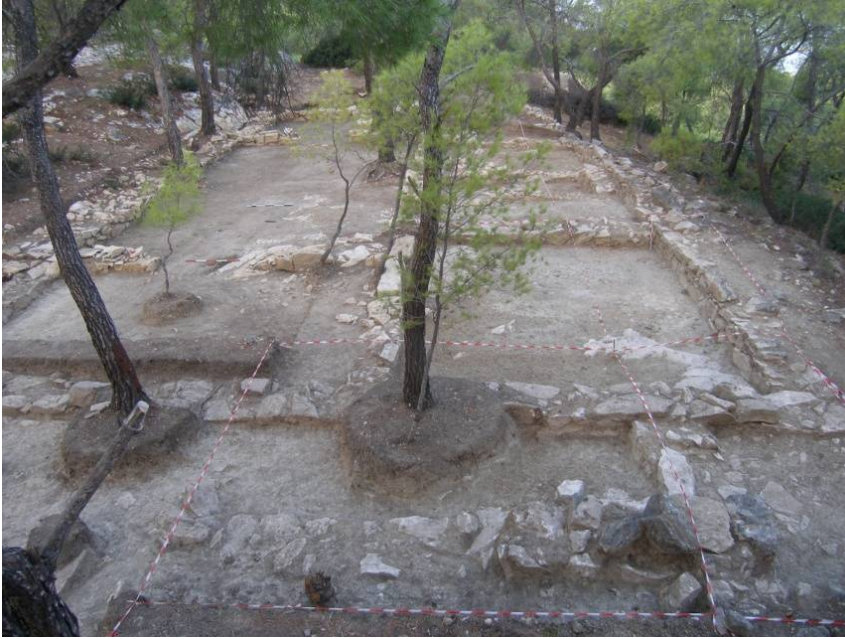
Σαλαμίς, Πυργιακόνι. Αποψη του μεγάλου Μυκηναϊκού συγκροτήματος από τα ανατολικά.

Η ιδιαίτερη λειτουργία του μείζονος αυτού κτηρίου, του οποίου το σχέδιο περιλαμβάνει μεγάλη υπόστυλη αίθουσα, με εμβαδόν 60 τ.μ. και κεντρική εστία, προορισμένη για τελετουργικές συναθροίσεις και συνεστιάσεις, θα πρέπει να είχε σχέση με τα δρώμενα οργανωμένης νεκρικής και ηρωικής λατρείας, η οποία ασκείτο από τους κατοίκους της γειτονικής ακρόπολης, λίγο πριν από την εγκατάλειψή της, στην άμεση περιοχή του Μυκηναϊκού κενотаφίου και απευθυνόταν, κατά πάσα πιθανότητα, στην σκιά μεγάλου τοπικού ήρωα (Αϊαντος;) και κορυφαίας (επώνυμης) μορφής της προγονολατρείας/ηρωολατρείας στο παρακείμενο τέμενος επτακόσια (700) περίπου έτη αργότερα.