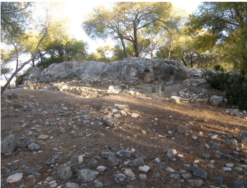
Σαλαμίς, Πυργιακόνη. Γενική άποψη του νοτίου-νοτιοανατολικού μετώπου της φυσικής εξέδρας του τεμένους, από τα ανατολικά.

Στην περιοχή του ερευνώμενου τεμένους των ιστορικών χρόνων, που διαθέτει δικό του περίβολο, κεντρική θέση κατέχει μεγάλη φυσική εξέδρα από ασβεστολιθικό βράχο (διαστάσεων 36 x 20 μ. περίπου), με επίπεδη γενικά άνω επιφάνεια και με κατακόρυφο μέτωπο στη νότια-νοτιοανατολική πλευρά. Στο ανώτερο αυτό επίπεδο (Βόρειο Τομέα), ο κύριος χώρος άσκησης λατρείας ορίζεται από περίβολο, σε σχήμα Γ, και περιλαμβάνει κτίσμα σε σχήμα Π (διαστάσεων 3,50 x 2,50 μ.), ανοικτό μπροστά (στα νότια) και με θύρα στη βόρεια πλευρά του, και σε ελάχιστη απόσταση από αυτό, βαθύ φυσικό κοίλωμα (λάκκο), με χοανοειδή πυθμένα (διαστάσεων 3 x 5,60 μ., μεγ. βάθους 3 μ. περίπου), που θα πρέπει να θεωρηθεί βόθρος εναγισμών (ενώ βρέθηκε μπαζωμένος με οικοδομικό, κεραμεικό και άλλο υλικό). Στο κατώτερο επίπεδο (Νότιο Τομέα) του τεμένους έχει αποκαλυφθεί μικρό συγκρότημα, προσκολλημένο στο μέτωπο της φυσικής εξέδρας, αποτελούμενο από μακρόστενο δωμάτιο, επιχρισμένο εσωτερικά με λευκό ασβεστοκονίαμα (πιθανότατα καθαρτήριο) και άλλο μεγαλύτερο, βοηθητικό (του ιερέα ή της ιέρειας), ενώ έχει διακριβωθεί η σύνδεση μεταξύ των δύο επιπέδων, μέσω κτιστής κλίμακος ή αναβάθρας, με ανοδική πορεία από νότο προς βορράν.