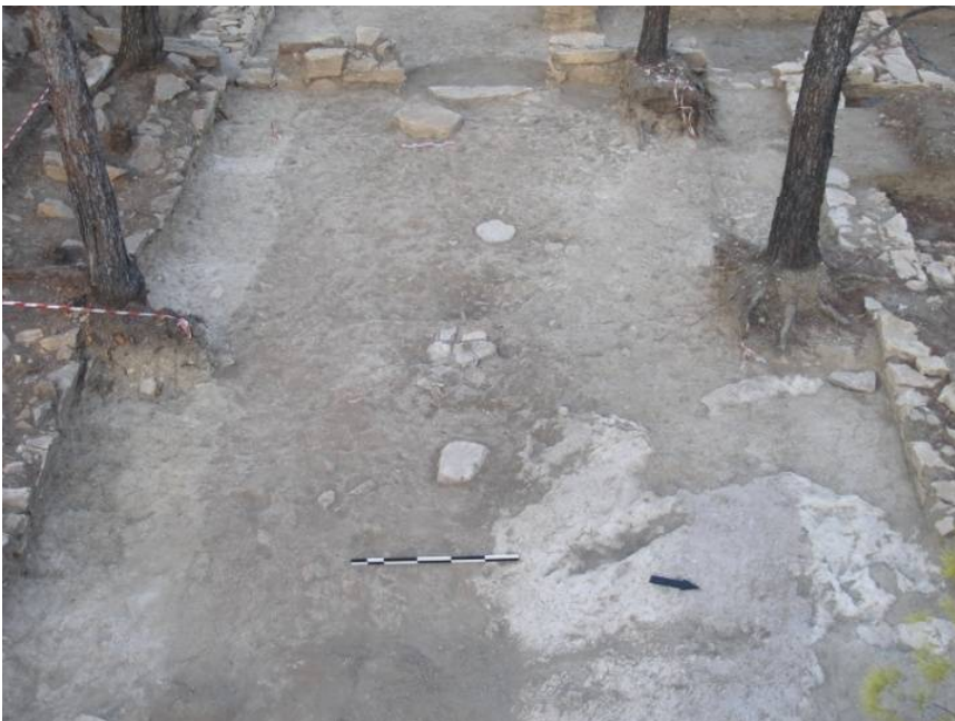
Σαλαμίς, Πυργιακόνι. Αποψη της υπόστυλης αίθουσας του Μυκηναϊκού συγκροτήματος, από τα ανατολικά.

Η ιδιαίτερη λειτουργία του μείζονος αυτού κτηρίου, του οποίου το σχέδιο περιλαμβάνει μεγάλη υπόστυλη αίθουσα, με εμβαδόν 60 τ.μ. και κεντρική εστία, προορισμένη για τελετουργικές συναθροίσεις και συνεστιάσεις, θα πρέπει να είχε σχέση με τα δρώμενα οργανωμένης νεκρικής και ηρωικής λατρείας, η οποία ασκείτο από τους κατοίκους της γειτονικής ακρόπολης, λίγο πριν από την εγκατάλειψή της, στην άμεση περιοχή του Μυκηναϊκού κενотаφίου και απευθυνόταν, κατά πάσα πιθανότητα, στην σκιά μεγάλου τοπικού ήρωα (Αϊαντος;) και κορυφαίας (επώνυμης) μορφής της προγονολατρείας/ηρωολατρείας στο παρακείμενο τέμενος επτακόσια (700) περίπου έτη αργότερα.