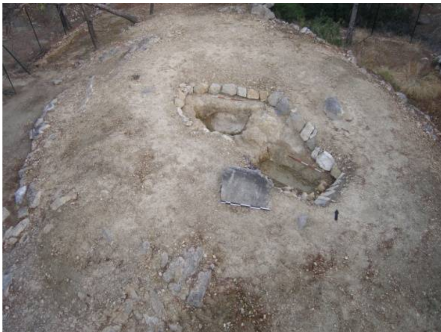
Σαλαμίσ, Πυργιακόνι. Ο μνημειακός τύμβος, με τα δύο ορύγματα στην κορυφή του, μετά την αποκατάσταση της προτεράϊας μορφής του.

Τα αρχαιολογικά κατάλοιπα που έχουν αναγνωρισθεί ή αποκαλυφθεί στο μικρό αυτό οροπέδιο συνθέτουν ένα φορτισμένο νεκρικό τοπίο, διαμορφωμένο ήδη από την Μυκηναϊκή εποχή και αισθητό μέχρι και την Πρωτοβυζαντινή, με ένα κτιστό καμαρωτό τάφο. Στα Μυκηναϊκά στοιχεία, εντοπισμένα σε τρία (3) διαδοχικά επίπεδα και διευθετημένα κατά ιεραρχικό τρόπο, με προφανή κοινωνική αντιστοιχηση στην ακρόπολη, από τα βόρεια προς τα νότια-νοτιοδυτικά, περιλαμβάνονται: Απλοί κιβωτιόσχημοι τάφοι, σαφή ίχνη θαλαμοειδών τάφων (σε δύο συστάδες) και μνημειακός τύμβος-κενοτάφιο (διαστ. 20 x 25 μ., ύψ. 2 και πλέον μ.), σε εμφανώς αναπεπταμένη θέση, με διπλό τεχνητό όρυγμα (εναγιστήριο) στην κορυφή του, σηματοδοτούμενος από ιδιαίτερο περίβολο και άμεσα σχετιζόμενος με χαμηλή, ακανόνιστη κυκλική, τελετουργική εξέδρα-πλατφόρμα (με μέγ. διάμ. 8,50 μ.) στα δυτικά του, σε χρήση κατά του έσχατους ΥΕ ΙΙΙ Β και πρώιμους ΥΕ ΙΙΙ Γ χρόνους, προφανώς από τους ενοίκους των κτηρίων της ακρόπολης. Το τελευταίο μνημείο, μοναδικό στο είδος του, που επέχει και θέσιν ηρώου, ανακαλεί περιγραφές τύμβων-κενοταφίων επωνύμων ηρώων και νεκρικές πρακτικές (εναγισμούς), όπως παραδίδονται στα Έπη.