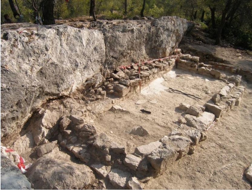
Σαλαμίς, Πυργιακόνι. Άποψη του δωματίου καθαριών του τεμένους μετά την ανασκαφή του, από τα νοτιοδυτικά.

Η περίοδος λειτουργίας του τεμένους στο Πυργιακόνι, για την οποία συμφωνούν απόλυτα τα κεραμεικά και νομισματικά ευρήματα από την ανασκαφή, καλύπτει τον 5 ο , 4 ο και τον πρώιμο 3 ο αιώνα π.Χ. Μετά την καταστροφή και κατάργησή του και την πιθανή μεταφορά της λατρείας στο αστικό κέντρο της Σαλαμίνας στην ανατολική ακτή, δεν αποκλείεται να έγινε πεδίο περιστασιακών καταπατήσεων.