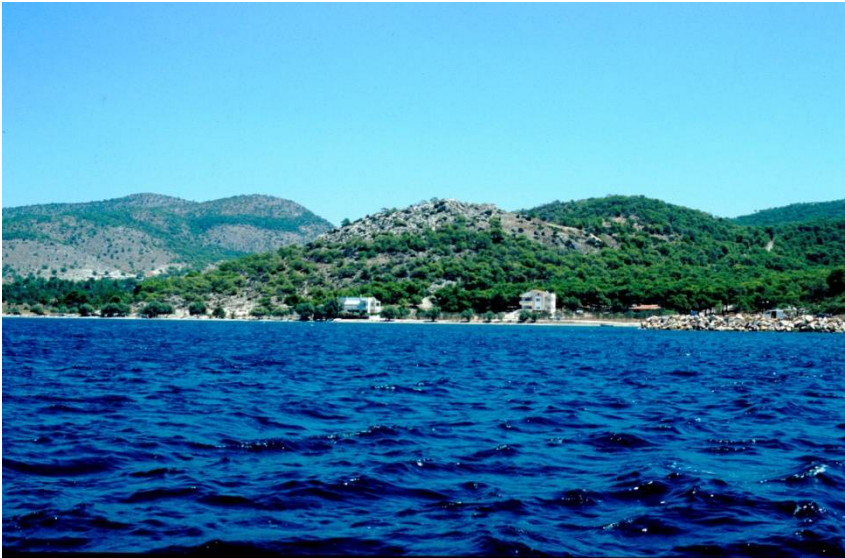
Σαλαμίς, Κανάκια. Άποψη της ακρόπολης από τα δυτικά.

Η ανασκαφή του Τομέα Αρχαιολογίας του Πανεπιστημίου Ιωαννίνων εξελίσσεται στην περιοχή Κανάκια από το 2000 και έχει υποστηριχθεί οικονομικά από το Πανεπιστήμιο Ιωαννίνων, τον Δήμο Σαλαμίνας, το Ίδρυμα Ιωάννου Φ. Κωστοπούλου, το Ίδρυμα Ψύχα και Σαλαμίνιους ιδιώτες-χορηγούς.