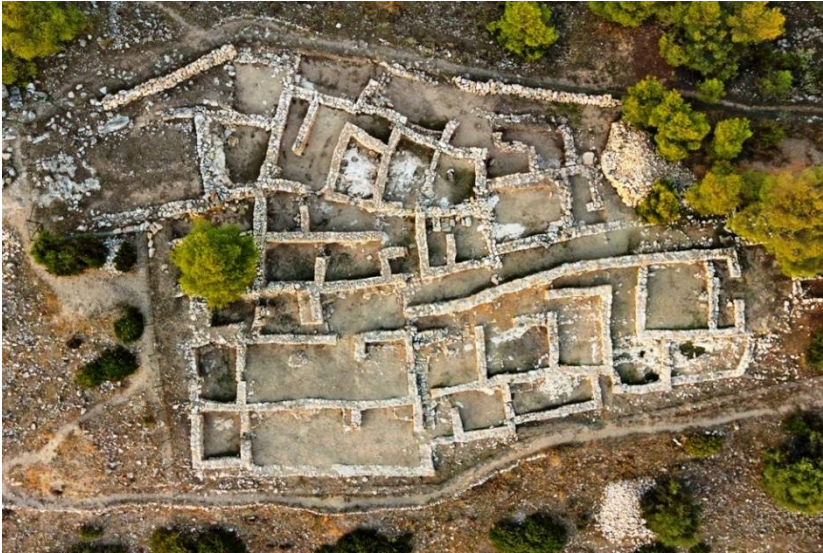
Σαλαμίς, Κανάκια. Το κεντρικό κτήριο της Μυκηναϊκής εποχής, με το δίδυμο μέγαρο.

προφανώς σχεδιασμένα και ελεγχόμενα από την τοπική Υστερομυκηναϊκή άρχουσα τάξη, ενώ στις πλαγιές εντοπίζονται συνοικίες της κάτω πόλης. Στα κορυφαία συγκροτήματα περιλαμβάνονται: το Κεντρικό Κτήριο (Γ), με εμβαδόν άνω των 750 m 2 , που ενσωματώνει ένα σύνολο δωματίων και διαδρόμων, δίδυμο επίσημο μέγαρο και μικρό ιερό, και το Ανατολικό Συγκρότημα, πολλαπλών χρήσεων δημοσίου χαρακτήρα, με κύρια πρόσβαση από μία ιδιότυπη πύλη οχυρής μορφής. Ανάμεσά τους αναπτύσσεται το Κτήριο Δ, με αποθηκευτικές, κυρίως, λειτουργίες.