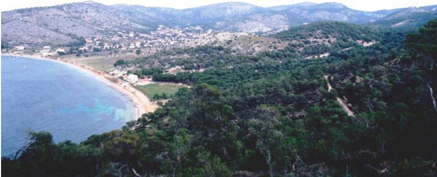
Σαλαμίς, Κανάκια. Άποψη της ακρόπολης από τα νοτιοδυτικά.

Από όλες τις προϊστορικές οικιστικές θέσεις, που έχουν εντοπισθεί στη Σαλαμίνα, η ακρόπολη των Κανακίων στη νοτιοδυτική ακτή παρουσιάζει την μεγαλύτερη διάρκεια χρήσης, τεκμηριωμένης ήδη από την Τελική Νεολιθική περίοδο (4η χιλιετία π.Χ.). Όπως και άλλα Μυκηναϊκά ανακτορικά κέντρα στην Ηπειρωτική Ελλάδα, το νησιωτικό αυτό κέντρο σημειώνει την μεγαλύτερη ακμή του κατά τον 13ο αι. π.Χ. και φαίνεται να εγκαταλείπεται οριστικά στις αρχές της Υστεροελλαδικής ΙΙΙ Γ πρώιμης περιόδου, λίγο μετά το 1200 π.Χ.