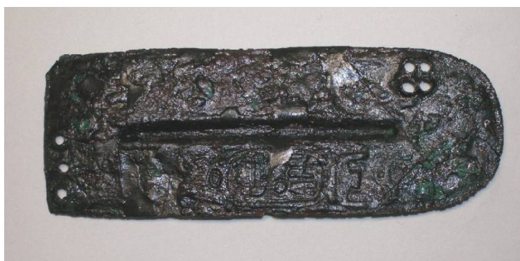
Σαλαμίς, Κανάκια. Φολίδα πανοπλίας Ανατολικού τύπου, με την δέλτο του Φαραώ Ραμσή Β'.

Εύρημα εντελώς μοναδικό, με ευρύτερες προεκτάσεις, από την ανασκαφή, είναι ένα χάλκινο έλασμα από φολιδωτή πανοπλία Ανατολικού τύπου, σφραγισμένο με το όνομα (βασιλική δέλτο) του Φαραώ Ραμσή Β' (1279-1213 π.Χ.).