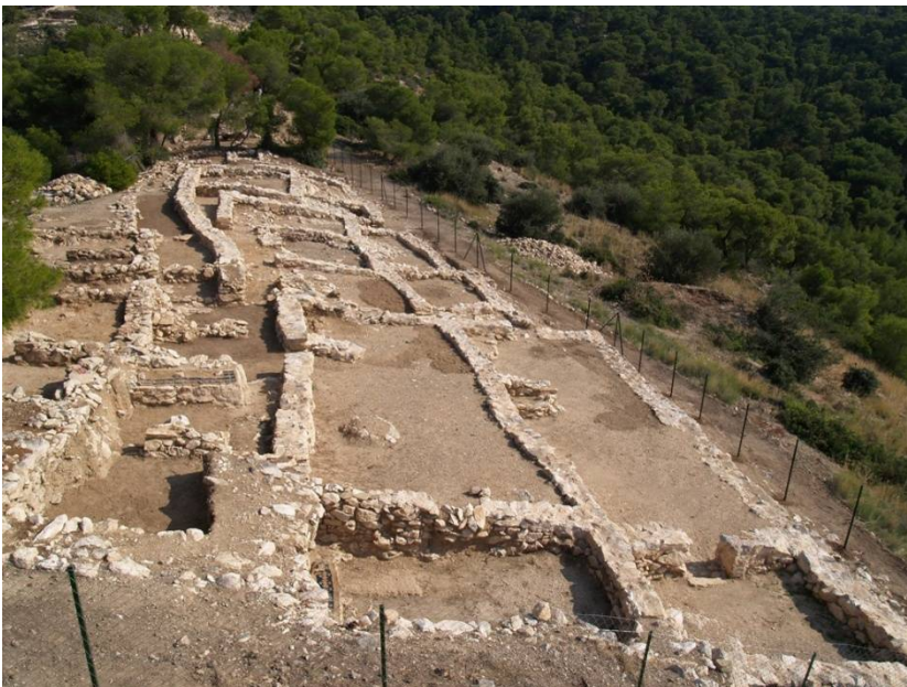
Σαλαμίς, Κανάκια. Το κεντρικό κτήριο της Μυκηναϊκής εποχής από τα δυτικά.